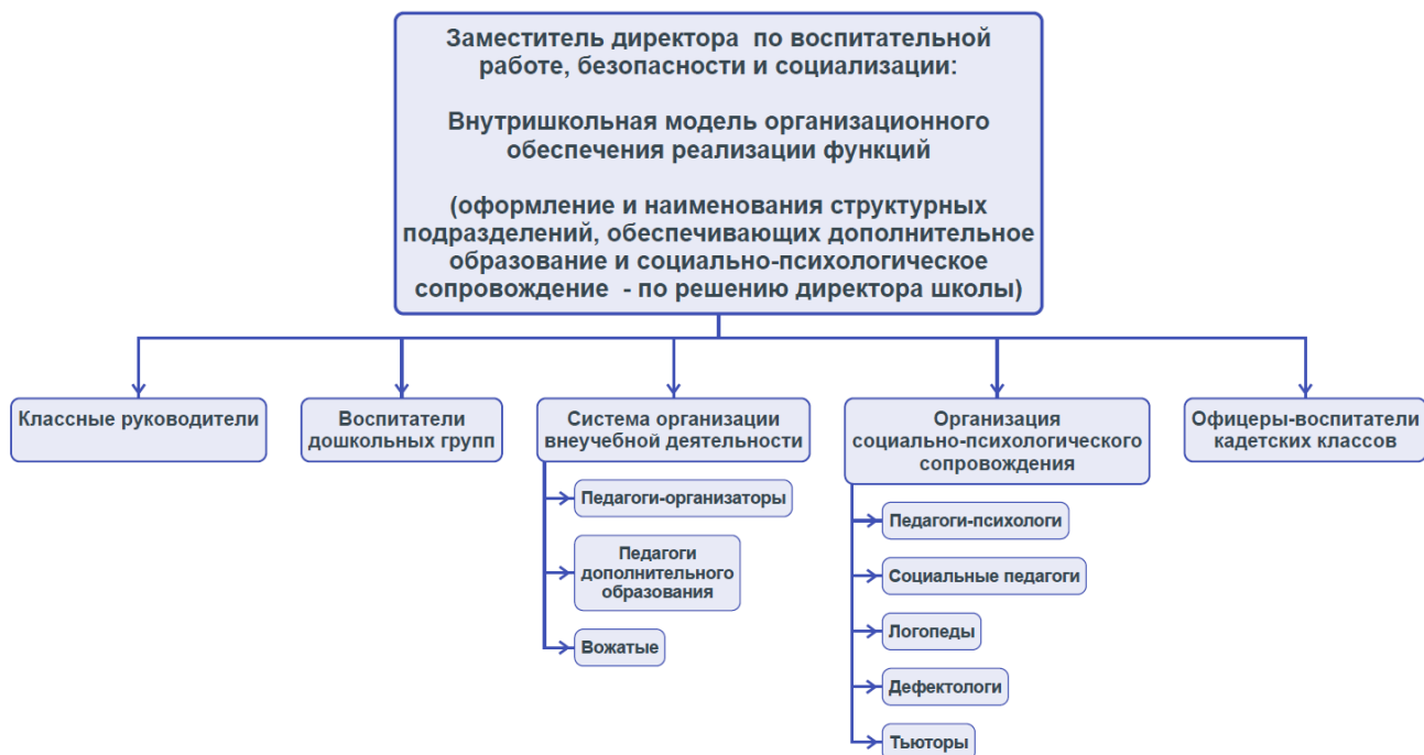
Схема 2. Кадровое обеспечение реализации программы воспитания

работников. Функционал работников регламентируется профессиональными стандартами, должностными инструкциями и иными локальными нормативными актами образовательной организации по направлениям деятельности.