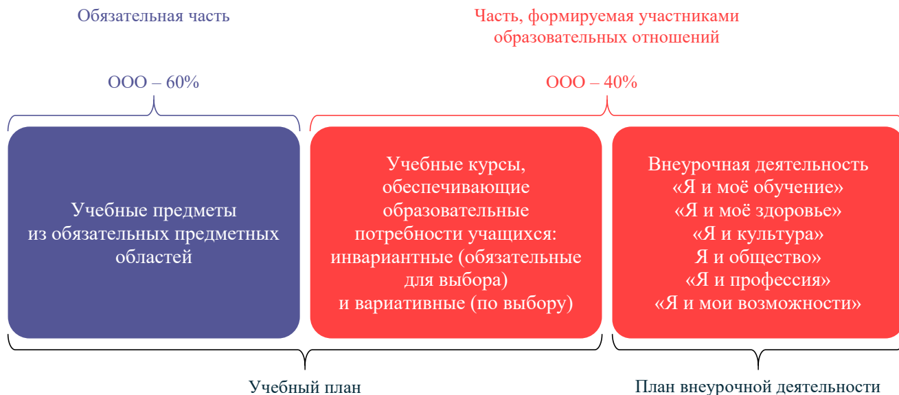
Схема 1. Части основной образовательной программы

Курсы внеурочной деятельности направлены на поддержку различных интересов, потребностей учащихся.